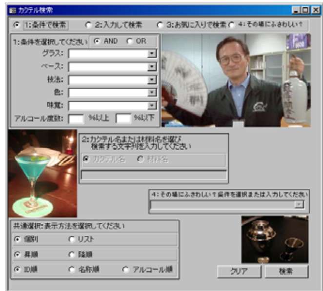
図 2 検索画面